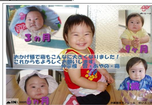
お子様の成長の記念に・・・