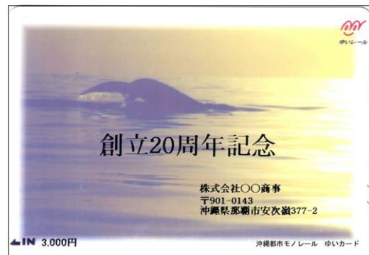
会社の創立記念に・・・

あなたのアイデアを活かした、独創的な「オリジナルカード」をつくってみてはいかがでしょうか。（※SFカードとは、Stored Fareカードの略称で、Storedは「蓄える」、Fareは「運賃」を意味しており、一定額を先払いでお支払いただく事で、そこから運賃を引き落とす方法をとる磁気カードのことをいいます。弊社のものは「ゆいカード」といっています。）