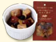
スモーク島豆腐のオイル漬け 「レーズン&アーモンド」