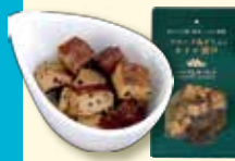
スモーク島豆腐のオイル漬け 「ハブ&ガーリック」