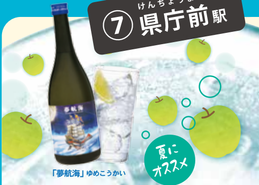
「夢航海」ゆめこうかい