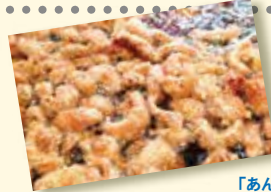
パリパリ「とりかわ」

沖縄産の「雪塩」・「赤マルソウ醤油」と 「泡盛」にじっくり漬け込み 一つ一つ丁寧に丸めた 1個がビッグな「からあげ」です。